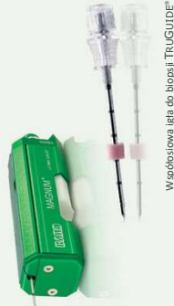
Współstawa igła do biopsji TRUGUIDE®

ZASKAKUJĄCO MAŁE... NIEZWYKLE MOCNE, KOMPATYBILNE ZE WSPÓŁSTAWĄ IGŁĄ DO BIOPSJI BARD® TRUGUIDE® - DLA WIĘKSZEJ WYDAJNOŚCI I DOKŁADNOŚCI