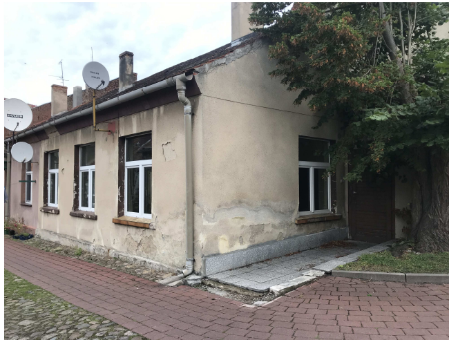
widok od strony elewacji frontowej

Przedmiotowy zakres prac remontowych nie ingeruje w elementy konstrukcyjne budynku.