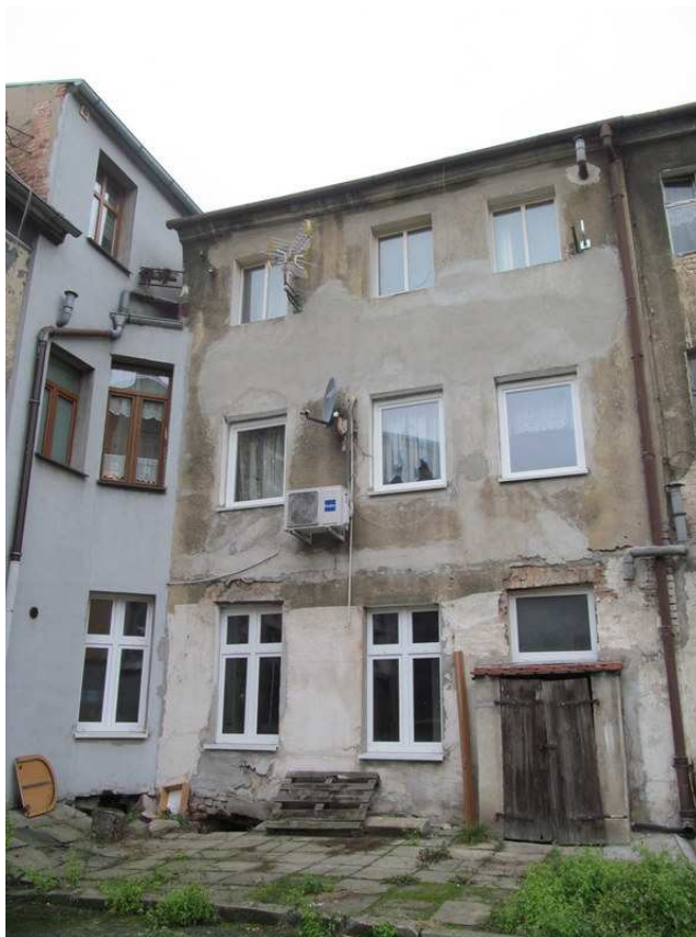
widok od strony elewacji frontowej

Przedmiotowy zakres prac remontowych nie ingeruje w elementy konstrukcyjne budynku.