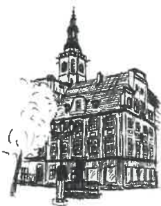
Rynek Wleża ratuszowa