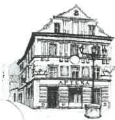
Kamienica „Pod Bykami”