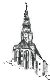
Kościół pw. Św. Stanisława i Św. Wacława Katedra Diecezji Świdnickiej