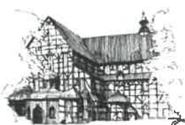
Kościół Pokoju pw. Św. Trójcy Wpisany na listę UNESCO