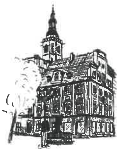
Rynek Wieża ratuszowa