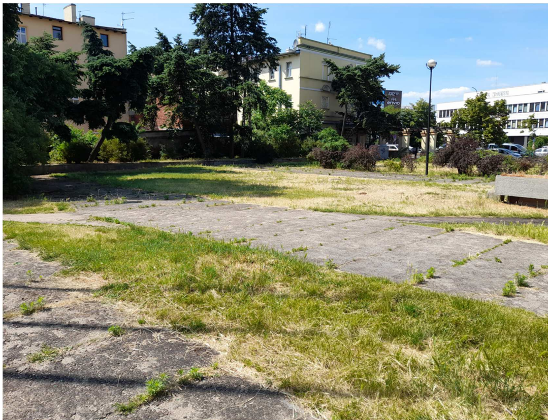
Zdjęcie 4 Widok w stronę ul. Jagiellońskiej