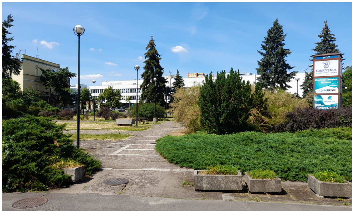
Zdjęcie 1 Widok od strony Bydgoskiego Domu Technika NOT