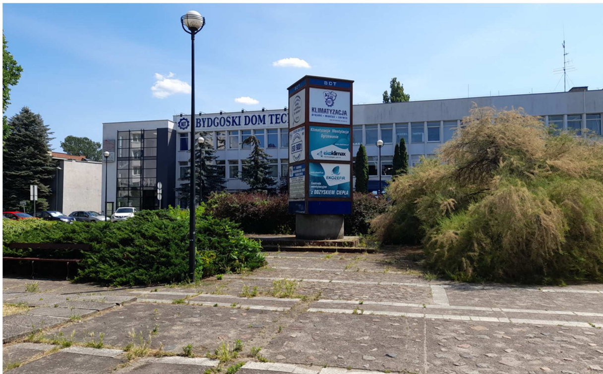
Zdjęcie 6 NOT