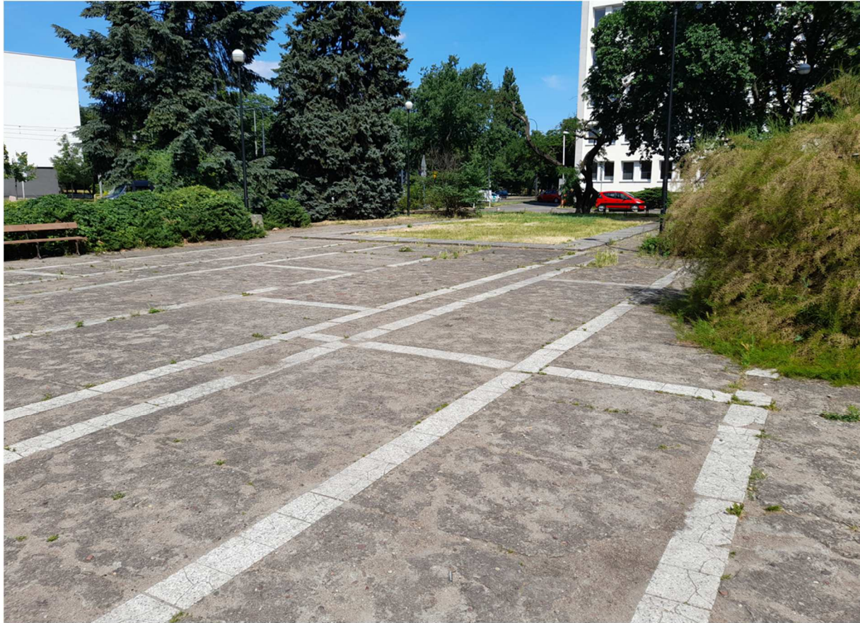
Zdjęcie 5 Widok na zasypany basen