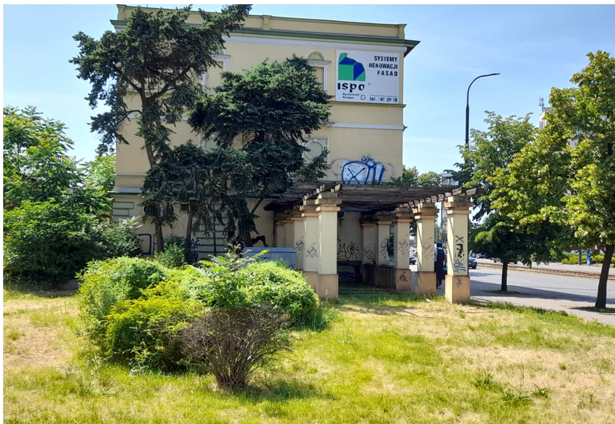
Zdjęcie 7 Ogrodowa pergola