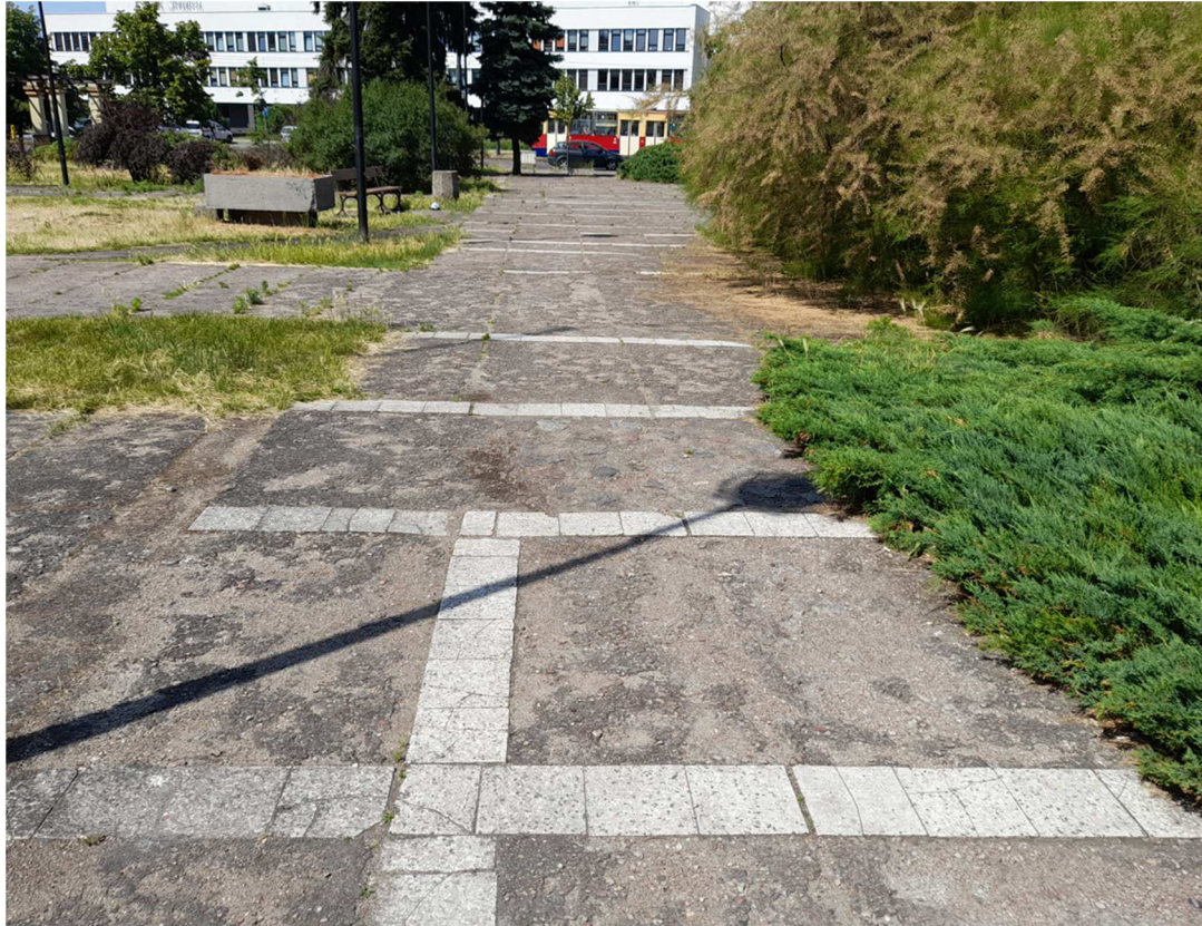
Zdjęcie 3 Główna alejka w Parku