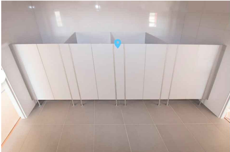
PRZYKŁAOWE WYKONANIE KABIN NATRYSKOWYCH (DRZWI WAHADŁOWE)