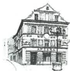
Kamienica „Pod Bykami”