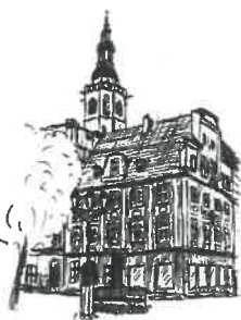
Rynek Wieża ratuszowa