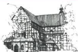
Kościół Pokoju pw. Św. Trójcy Wpisany na listę UNESCO